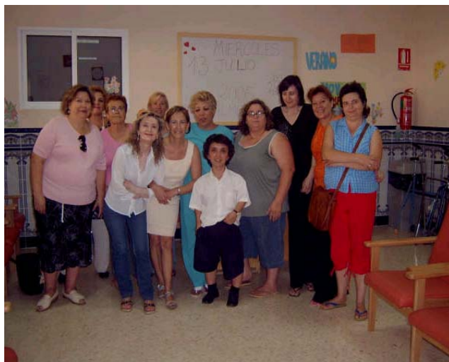
Nuestras compañeras de Almería reunidas el pasado mes de julio

Además os adelantamos que estamos preparando, en colaboración con la Asociación para la Promoción de la Mujer con Discapacidad 'LUNA' , un foro virtual para que podamos entrar en contacto y discutir de forma ágil aquellas cuestiones que más nos preocupan. Vinculado a la página web de CANF COCEMFE Andalucía pronto estará a vuestra disposición este nuevo espacio.