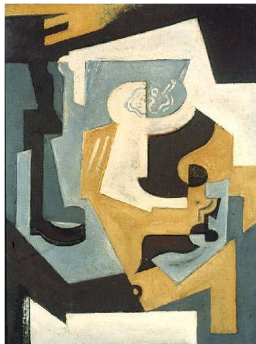
Naturaleza muerta cubista 1918

La artista murió de tuberculosis en París el 5 de abril de 1932.